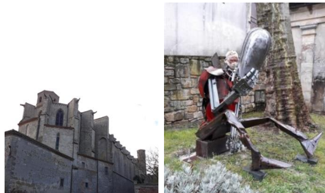
La Collégiale de Montréal La structure métallique

Tous les randonneurs nous ont rejoints au bus où nous avons pris le pot de l'amitié comme à l'accoutumée, après cette journée bien remplie ! Mireille